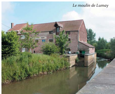
Le moulin de Lumay

Le moulin de Lumay était un moulin à farine mû par une roue hydraulique de la force de 10 chevaux. Cette « usine » (Tarlier et Wauters) a toujours appartenu aux seigneurs du village. Au début du 19e siècle, on comptait sept brasseries et 5 genièvreries à Zétrud-Lumay et à Outgaerden (Outgaerden). Toutes ces usines ont successivement fermé.