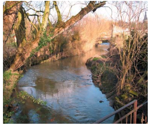
La Grande Gette à Jodoigne

pour en savoir plus http://environnement.wallonie.be/de/dcenn