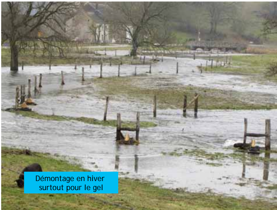
Démontage en hiver surtout pour le gel