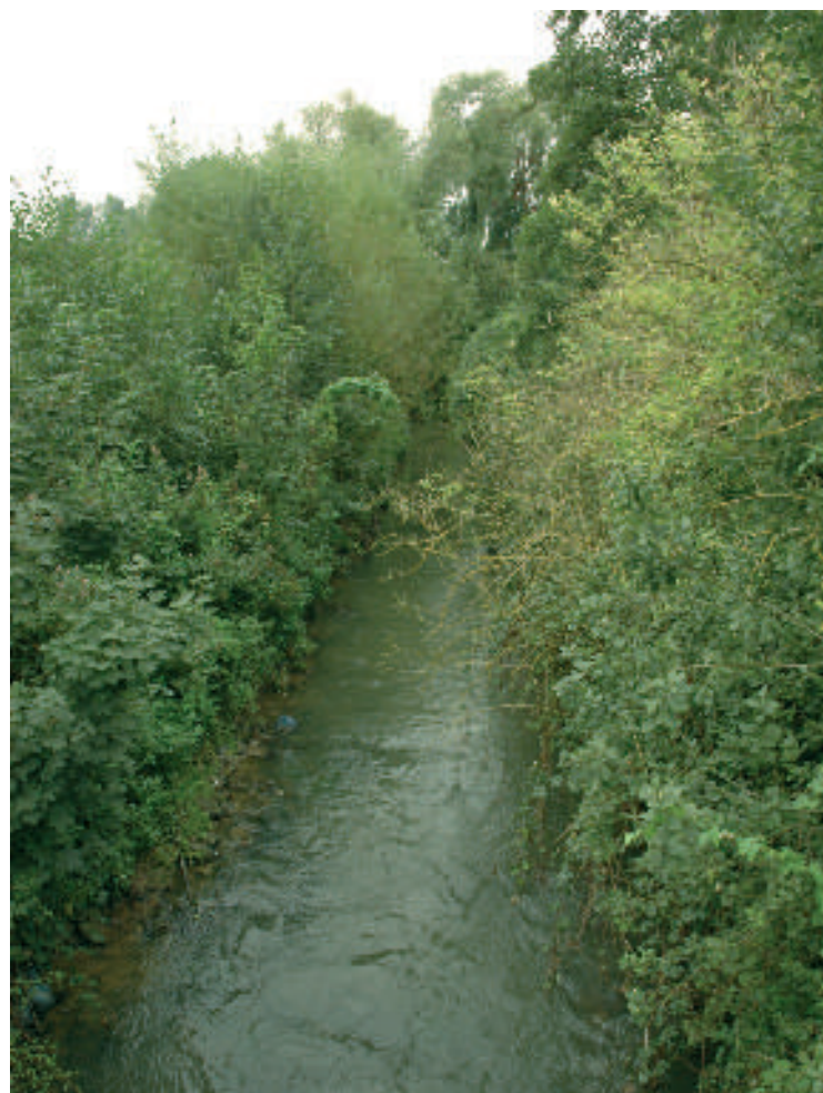
La Dyle traverse les anciennes usines Henricot

La vallée de la Dyle à Court-Saint-Étienne, c'est aussi :