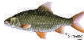
Le gardon (20-35 cm)

À Court-Saint-Étienne, on dénombre 4 espèces de poissons dans la Dyle : une majorité de gardons ainsi qu'un certain nombre de goujons et perches , de même que plusieurs tanches . Il semble clair qu'une partie des gardons et goujons proviennent d'étangs situés en amont. D'après les pêcheurs locaux, le chevaine et le barbeau étaient présents au début du siècle dans les eaux de la Dyle. Aussi, elle comptait une population de rotengles dont l'absence pourrait confirmer la qualité moyenne du cours d'eau. Des espèces comme le chevaine et le rotengle ainsi que le brochet et la brème pourraient faire l'objet d'une réintroduction dans la Dyle sous certaines conditions, entre autres, l'aménagement de zones de reproduction, la restauration de berges naturelles (habitat) et l'amélioration de la qualité des eaux.