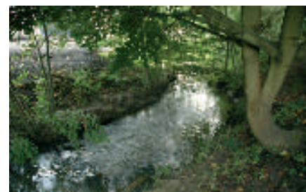
Le Gala (ou Cala) à son arrivée à Court-Saint-Étienne

Petite anecdote : « Quel rapport peut-il y avoir entre le bathyscaphe du célèbre suisse Auguste Piccard, immortalisé par ses aventures abyssales, et Court-Saint-Étienne ? La construction de la nacelle de l'engin ! Commencée en 1946 aux fonderies des usines Henricot et achevée un an plus tard, elle constitue le fleuron de l'âge d'or des célèbres établissements. » (in Histoire(s) en Dyle , Centre culturel du Brabant wallon, 2005)