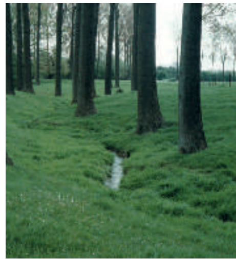
La Dyle à Houtain-le-Val