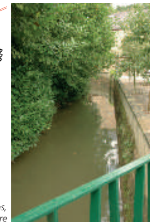
La Dyle côté jardins, rue des Ponts de Pierre