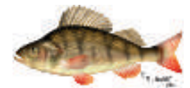
La perche (20-35 cm)

Illustrations de P. J. Dunbar, Service Technique de la Province de Liège