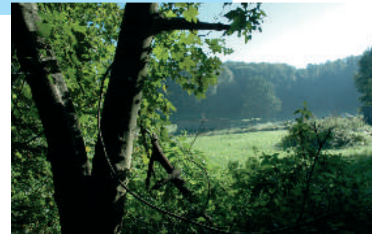
Vue sur les Plantées des Dames, entre Bousval et Faux

Le parcours de la Dyle est jalonné par différents sites naturels dont le plus intéressant est constitué par le bois de Noirhat et les Plantées des Dames . Ce site naturel est protégé à l'échelle européenne par le programme Natura 2000. Ce programme s'attache à préserver certains milieux naturels fragiles et les espèces qu'ils abritent.