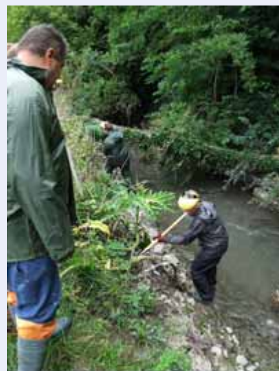
Contrôle des plantes invasives

De septembre 2009 à avril 2010, le CR Haine a réalisé l'inventaire des points noirs de ses cours d'eau classés (appartenant au domaine public), et démarre l'inventaire des cours d'eau non-classés (gestions privées, ruisseaux proches de la source). La rédaction du programme d'actions a été achevée au mois d'octobre et il sera effectif le 22 décembre 2010.