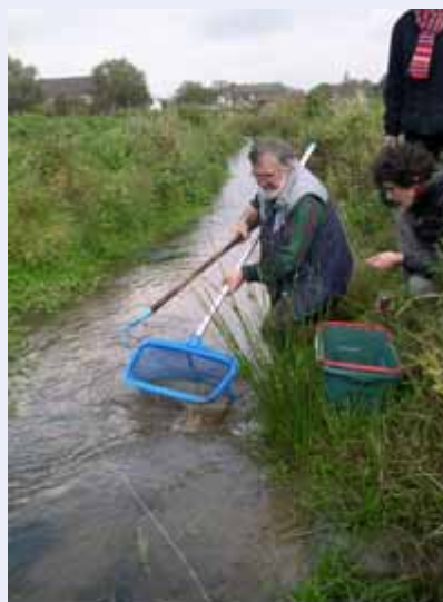
Surveillance des populations de poissons

Une cellule de coordination permanente permet de suivre tout au long de l'année les activités des différents acteurs de l'eau, remplaçant des dissensions éventuelles par des liens forts et initiant une réelle synergie entre tous les partenaires.