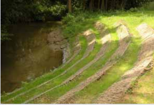
Aménagement et stabilisation des berges

Les premiers Contrats de Rivière ont été créés dans les années '90. A cette période, chacun, pourvu qu'il rassemble les administrations communales concernées, pouvait fonder son Contrat de Rivière. Cela a mené à des situations où coexistaient plusieurs CR dans un même sous-bassin hydrographique.