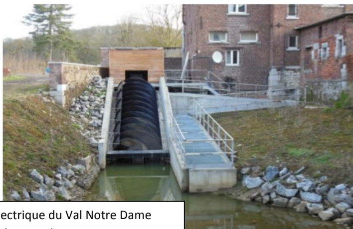
Centrale hydroélectrique du Val Notre Dame (sur la Mehaigne à Wanze)