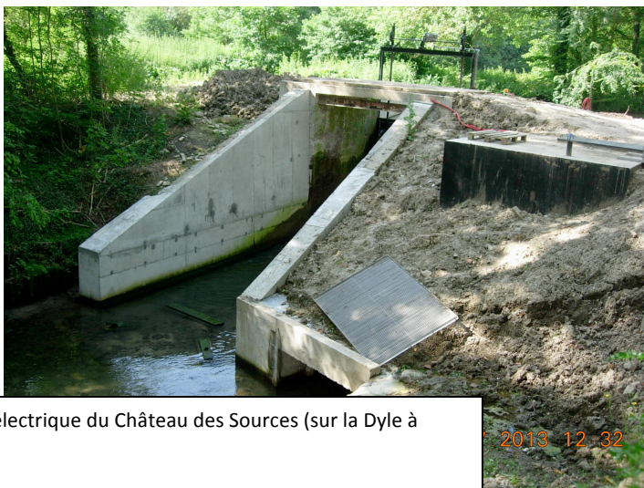
Centrale hydroélectrique du Château des Sources (sur la Dyle à Genappe)