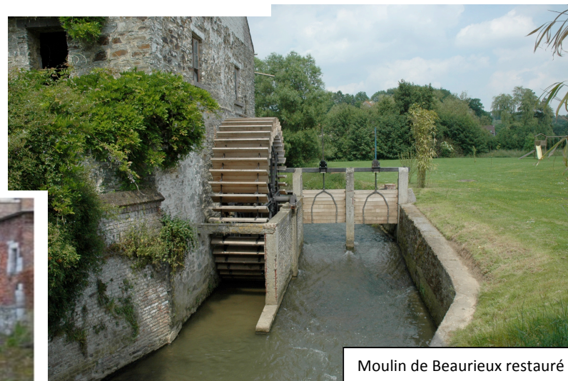
Moulin de Beurieux restauré (sur l'Orne à Court Saint Etienne)