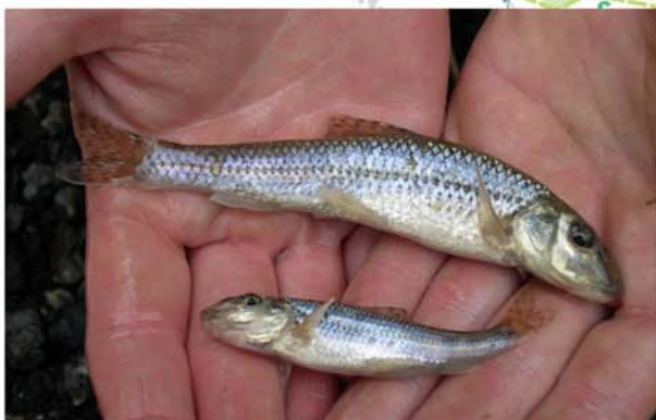
Le goujon est présent dans la Dyle

Données poissons : Service de la pêche - SPW, CR Dyle (2000-04), FUNDP (1993) Cartographie et conception : CCBW - cellule Contrat de rivière (février 2009) Fond de carte : Copyright Cartobel s.a. (2009)