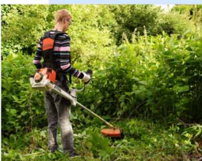
Gestion de renouées du Japon

Tout le monde peut (devrait) donc participer à cet inventaire ... Contactez le Contrat de rivière ou votre commune.