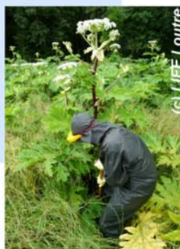
Gestion de berces du Caucase