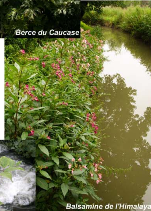
Balsamine de l'Himalaya