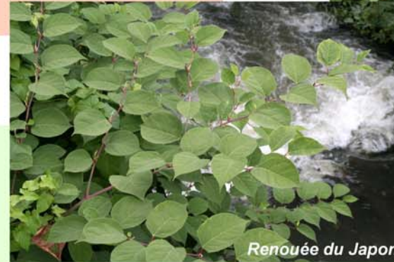
Renouée du Japon