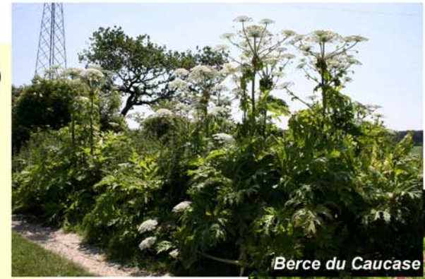
Berce du Caucase

Les communes et les associations partenaires du Contrat rivière ont été sollicitées pour participer à cet inventaire, actuellement en cours de finalisation.