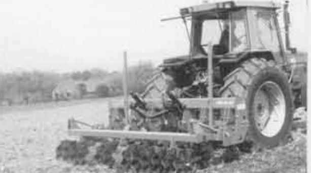
Le traitement superficiel du sol avec maintien des résidus de récoltes en surface est aussi proposé aux agriculteurs.

Olivier Evrard (Université catholique de Louvain) a mesuré l'efficacité de mesures pilotes prises dans la région de Saint-Trond. Grâce au Décret "érosion" adopté en Flandre en 2001, les communes flamandes reçoivent des subventions pour réaliser leur plan de lutte anti-érosion. Par la suite, la Région flamande intervient encore à hauteur de 75% pour installer les mesures préconisées par le plan.