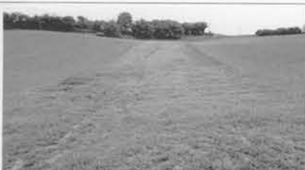
L'aménagement de chenaux enherbés implantés dans l'axe naturel d'écoulement des eaux favorise le ralentissement du ruissellement et l'infiltration des eaux dans le sol.

Le suivi de l'efficacité des mesures dans la région de Saint-Trond : Département de Géographie de l'UCL Olivier Evrard : evrard@geog.ucl.ac.be