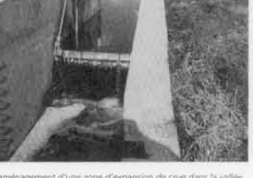
L'aménagement d'une zone d'expansion de crue dans la vallée du Henri-Fontaine à Hannut est un exemple de solution préventive contre le débordement du cours d'eau dans les zones habitées.

D'autres mesures permettent tout au plus de limiter les conséquences de l'érosion en dehors de la parcelle. Parmi ces mesures dites palliatives, les bandes enherbées permettent de ralentir le ruissellement et facilitent le dépôt des sédiments en suspension. Situées à